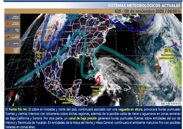
IMAGEN DE SATELITE

Cielo despejado a medio nublado. Bancos de niebla dispersos y posibles heladas en Puebla, Hidalgo y Tlaxcala. Ambiente frío por la mañana y caluroso por la tarde. Viento de dirección variable de 15 a 30 km/h.